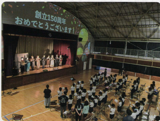
上三川町立北小学校 児童代表お礼のことば (令和6年10月30日)