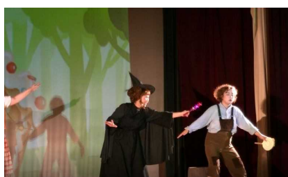
魔法をかけられたヘンゼル