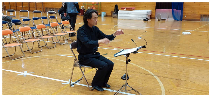
指揮者（客席で指揮をします。）