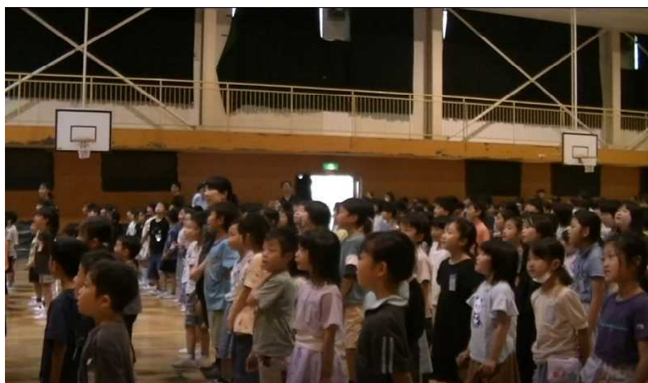
元気に校歌を歌う山辺小の子どもたち

前半3校では、明るく元気な子どもたちとの出会いがありました。後半の学校ではどんな出会いが待っているか楽しみです。