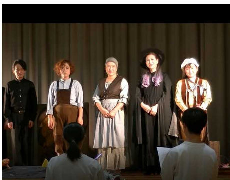
生徒代表お礼の言葉