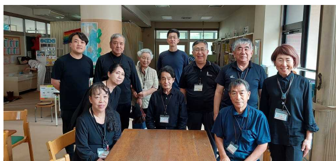
表情豊かな(?)キャストの面々 公演を裏で支えるスタッフたち

今回は、オペラ「ヘンゼルとグレーテル」が、学校の体育館でどのように上演されているか、その舞台裏を紹介します。