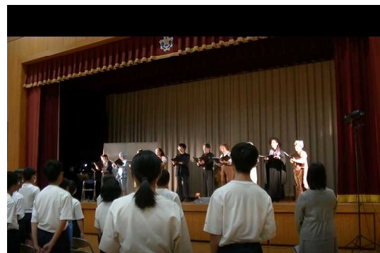
出演者、生徒全員で校歌斉唱