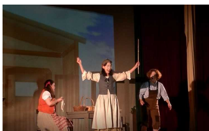
お母さんに叱られる兄妹