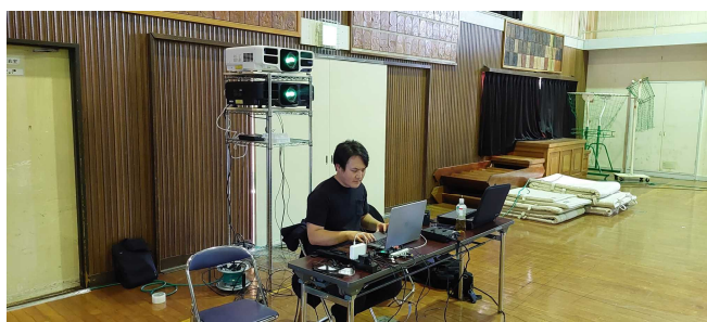
大型プロジェクターとその操作 映像を舞台の大きさに合わせる