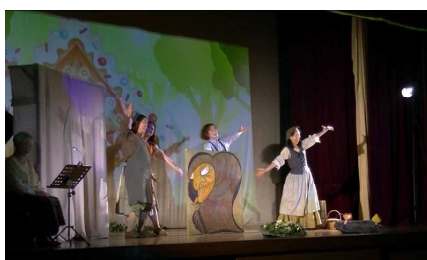
めでたしめでたし