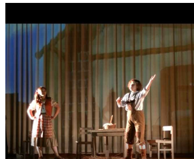
ハンゼルとグレーテル登場