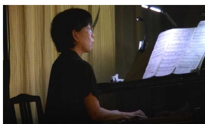
ひとりオーケストラ

さて、このような流れで上演された山辺小は、大内中央小同様、今年が創立150周年という記念すべき年で、児童数400名余りと今回のツアーでは一番規模の大きな学校でした。廊下で会うと、どの子どもみんな「こんにちは！」と元気に挨拶してくれました。