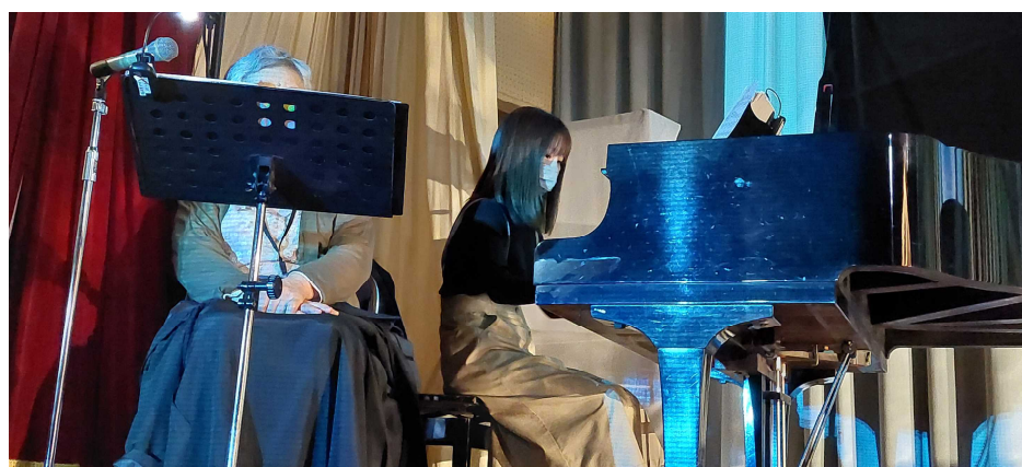
ピアニストとナレーター

本番では、会場の窓に暗幕をつけて暗くしてしまいますので、指揮者とピアニストの譜面台にはライトが付けられています。因みに「ヘンゼルとグレーテル」の演奏時間は抜粋でも約50分かかります。伴奏は、本来ならオーケストラが担当しますが、学校公