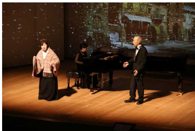
第1部「ラ・ボエーム」より