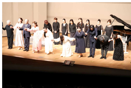
第2部 カーテンコール