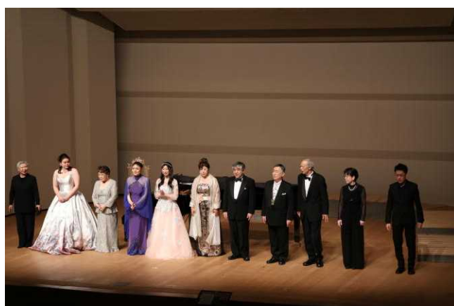
第1部 カーテンコール