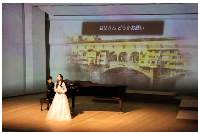
第1部「ジャンニ・スキッキ」より