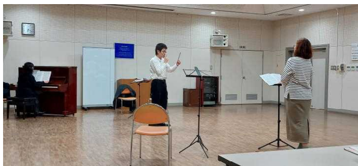
玉崎先生の音楽稽古