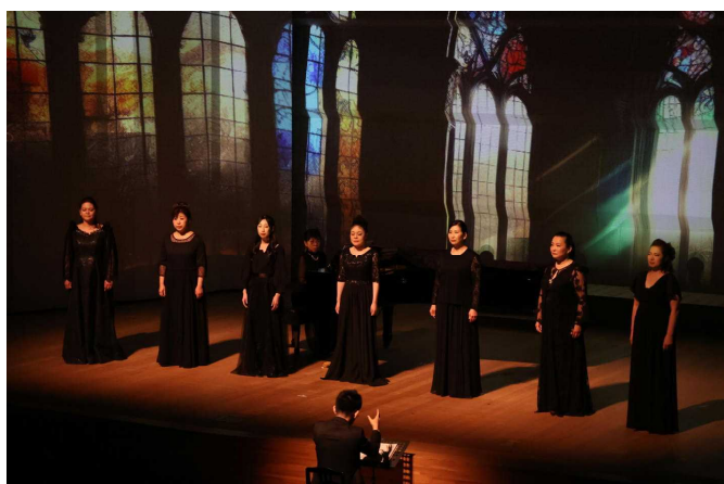
第1部「修道女アンジェリカ」より