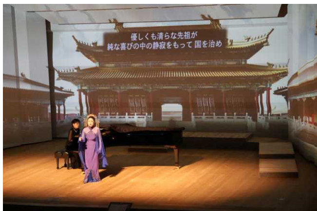
第1部「トゥーランドット」より