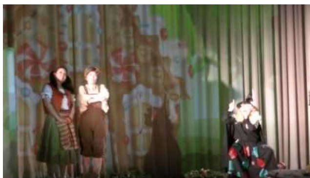
甘い言葉で二人を誘う魔女