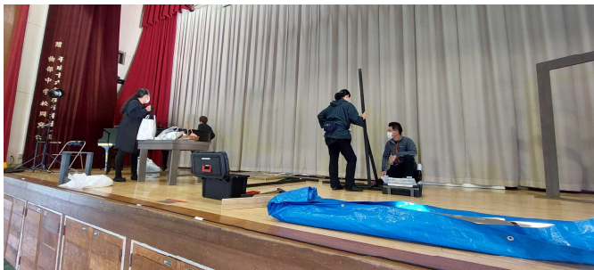
舞台の仕込みの様子