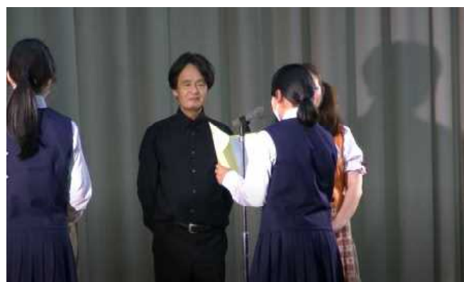
お礼の言葉と花束贈呈