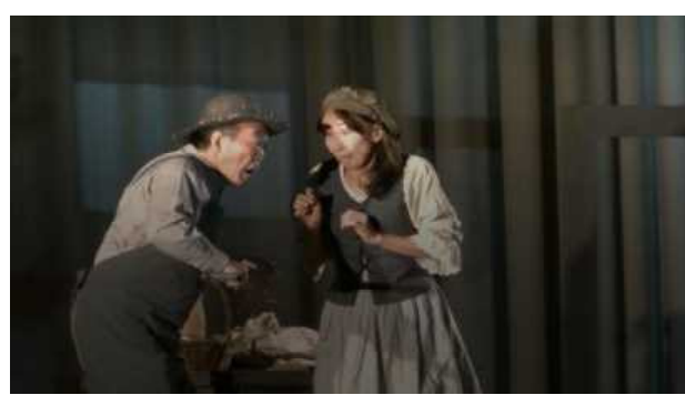
魔女の森に行った二人を心配する両親