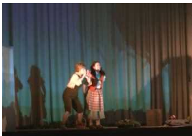
森で道に迷ってしまった二人