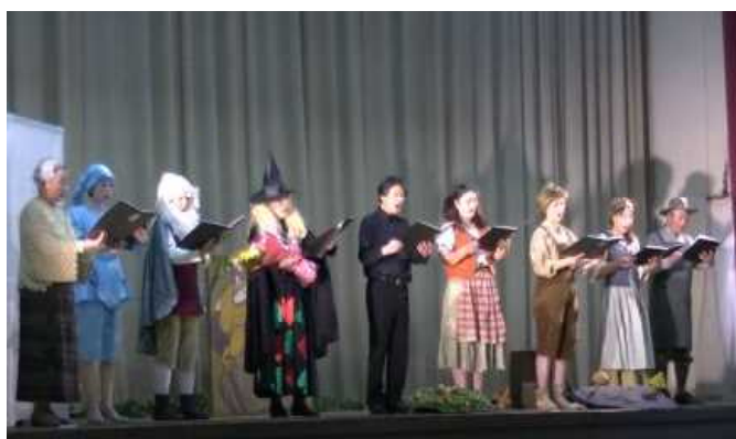
物部中校歌を歌う出演者