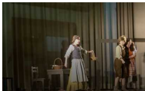
二人は森にイチゴを取りに行かされることに