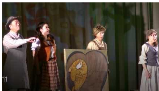
お菓子になった魔女（大団円）