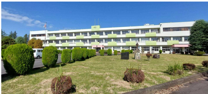
豊かな田園やイチゴハウスの中にある物部中