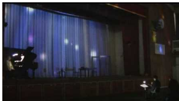
暗転の中で演奏される厳かな前奏曲