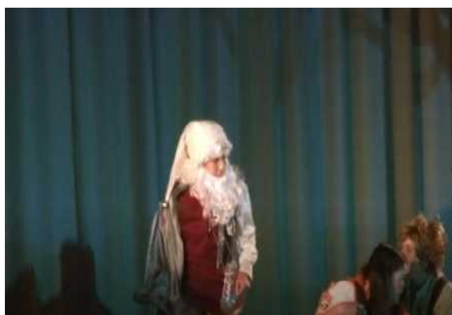
二人を眠りに誘う眠りの精