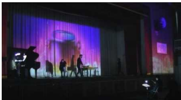
第2幕への場面転換(美しいPMの映像をバックに)