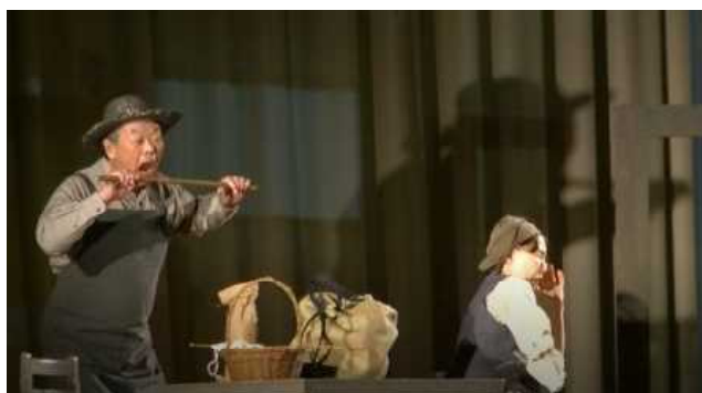
酔っ払って帰ってきたお父さんにお母さんはイライラ