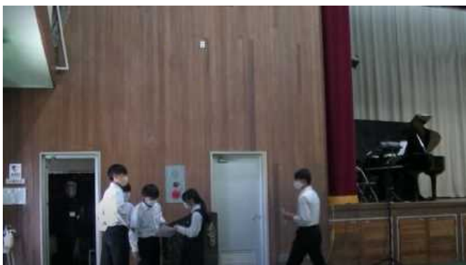
司会進行の生徒の皆さん