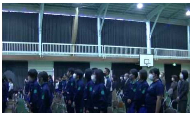
一緒に校歌を歌う生徒の皆さん