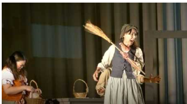
仕事が終わっていない二人にヒステリーを起こすお母さん