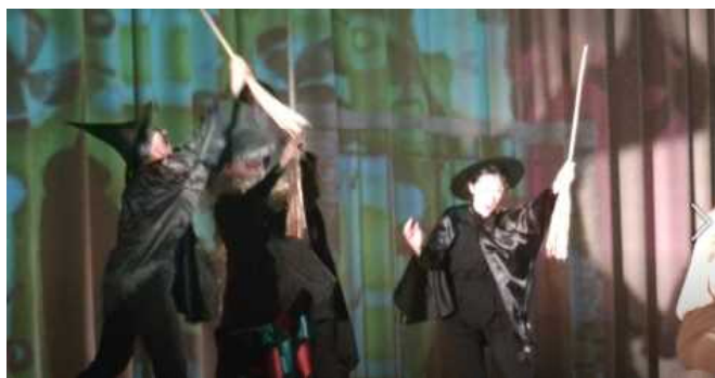
魔女と小魔女の不気味なダンス