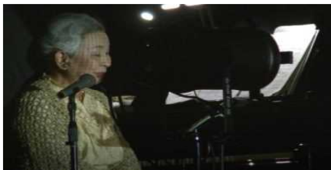
ナレーターの前振り