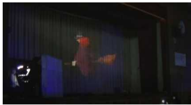
体育館を飛び回る魔女(PMの映像)