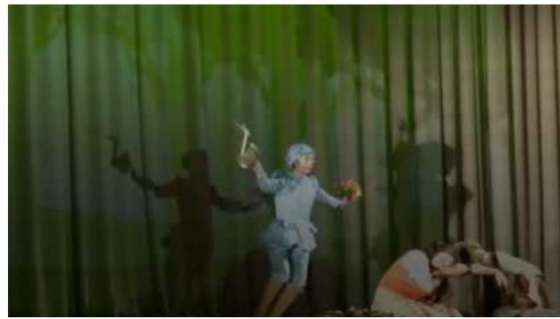
夜明けに二人を目覚めさせる露の精