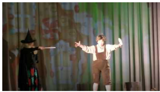
魔法で動けなくなったヘンゼル