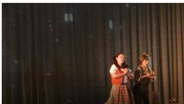
心が洗われるような祈りの二重唱