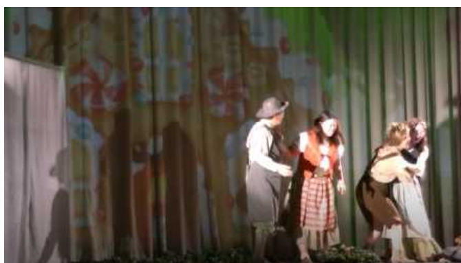
再会を喜び合う家族