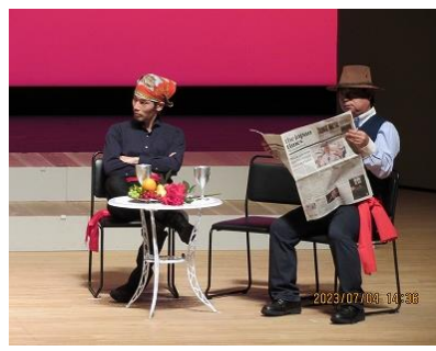
特別出演の作新の先生方