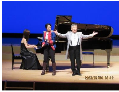
「フィガロの結婚」より