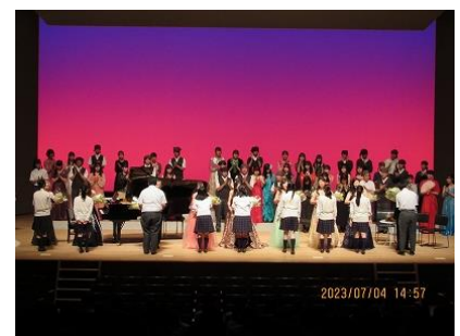
出演者に花束贈呈

コンサートの後半で一緒に演奏に参加してくれた1年生の生徒さん（音楽授業選択）の感想です。