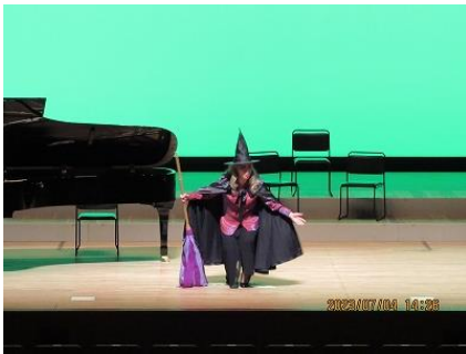
「ヘンゼルとグレーテル」より