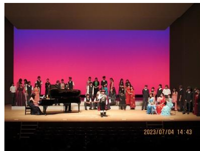
「カルメン」より「闘牛士の歌」